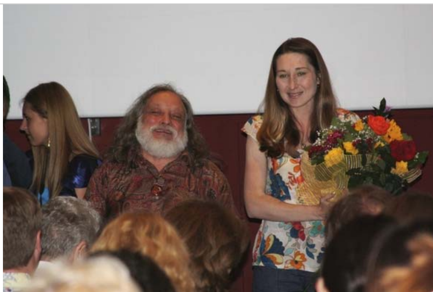
Чарльз Бронсон и Евгений Латышев на просмотре документального фильма «Меняется ли человек»