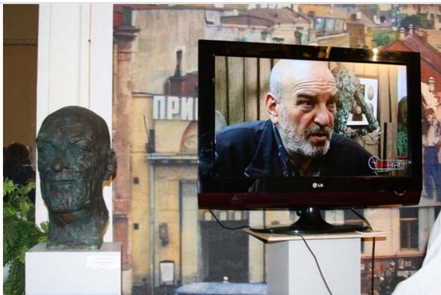
В скульптурном портрете Алексея Петренко - мужской шарм, артистичность, глубина и искренность чувств.