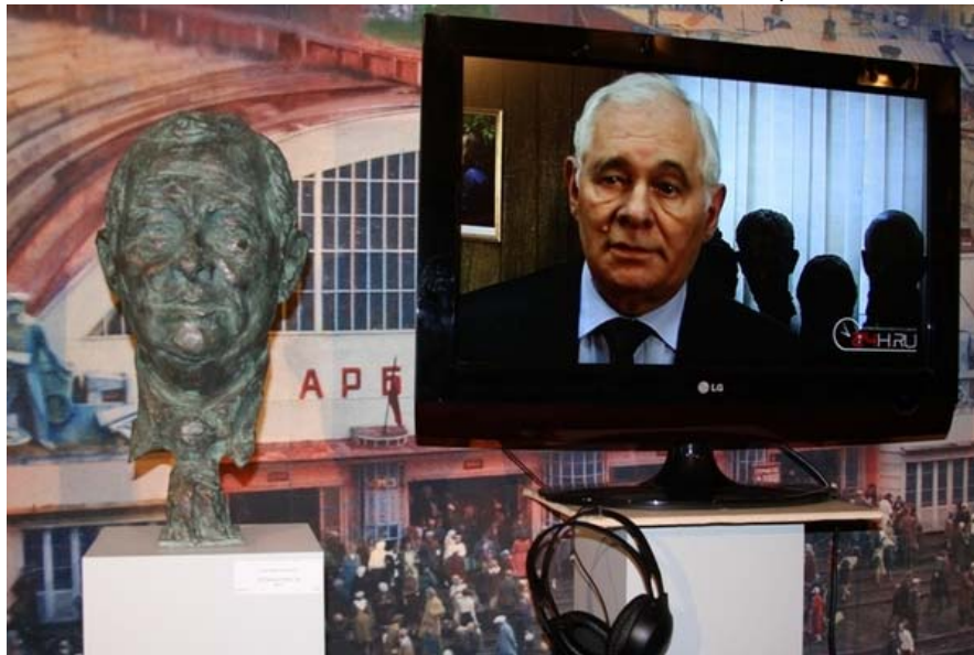
Скульптурный портрет врача Леонида Рошаля работы Григория Потоцкого.