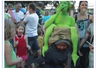
Фестиваль живых скульптур в Израиле