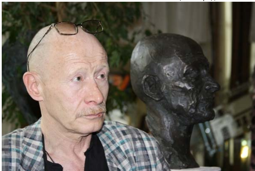
Актер Виктор Проскурин: «Его посетило внутреннее вдохновение - он сделал такой скульптурный портрет».